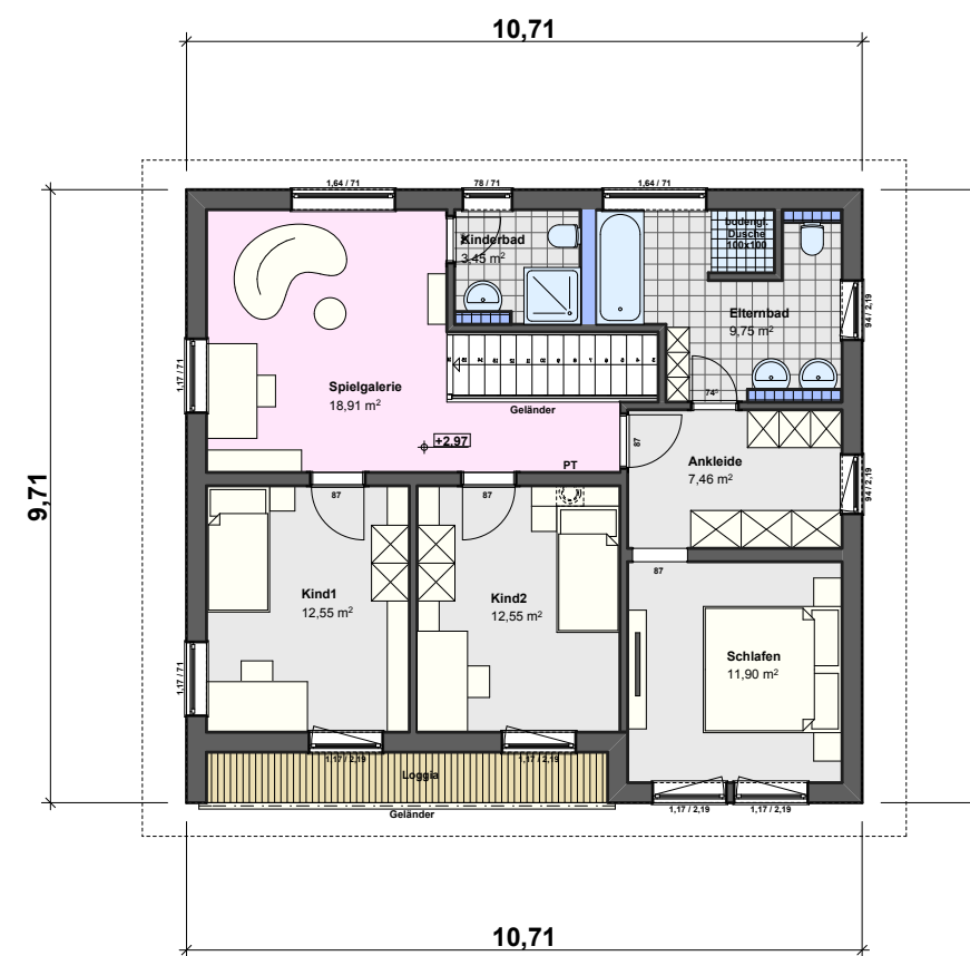
Haus 1 OG