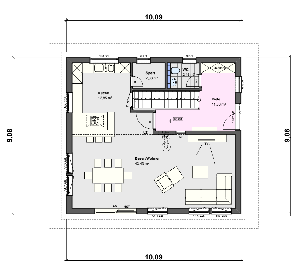
Haus 1 EG